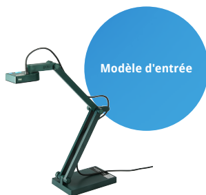
Visualiseur V4K ultra haute définition USB

Trouvez le meilleur visualiseur IPEVO pour vous