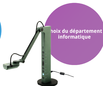
Visualiseur VZ-R HDMI/USB mode mixte 8MP